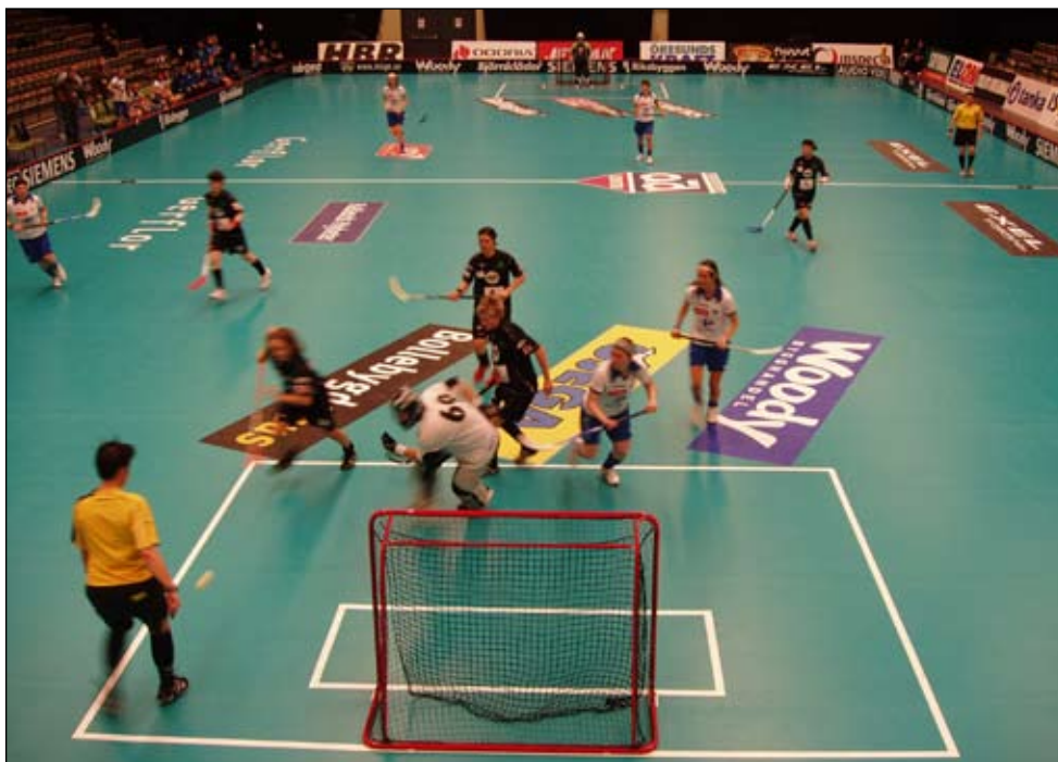
European Cup-finalerne i floorball for klubhold i svenske Varberg for nylig er et eksempel et arrangement med web-tv-dækning. Floorball/innebandy er Sveriges næststørste holdsport med 130.000 licensspillere.

Inden for kort tid åbner hjemmesiden www.takenfrivillig.dk , hvor det er muligt at læse mere om kampagnen.