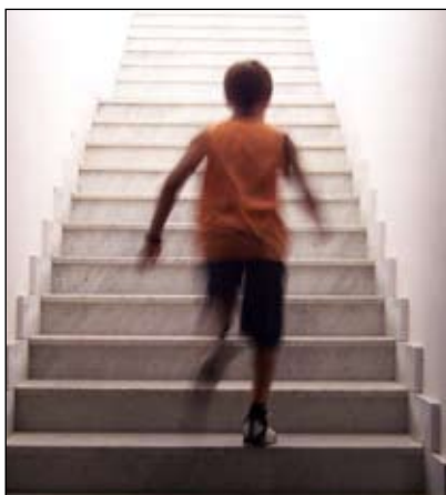
Det kræver en bredere indsats at forbedre børns fysiske form, konkluderer Ballerup-undersøgelsen.